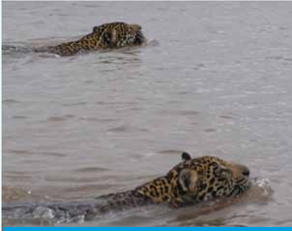
Yaguaretés nadando por el río Paraguay.

Meta 2.1.4: Elaborar planes de gestión/manejo para los humedales con el fin de asegurar la preservación de sus características ecológicas, sus funciones y beneficios.