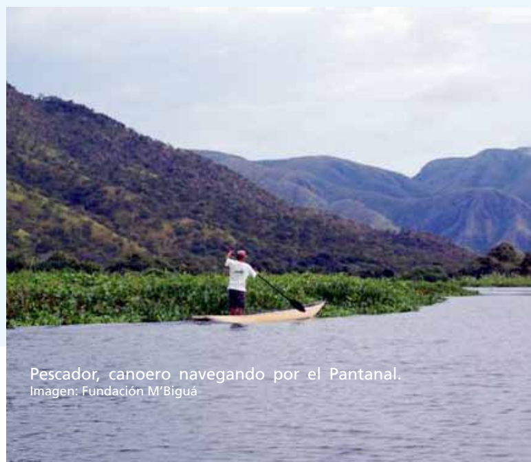
Pescador, canoero navegando por el Pantanal.

Meta 5.3.3: Rescatar y valorizar las prácticas y saberes medicinales tradicionales e incorporar a sus principales agentes (curanderos, matronas, sanadores, entre