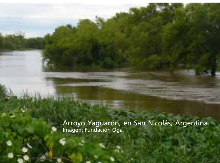
Arroyo Yaguarón, en San Nicolás, Argentina.