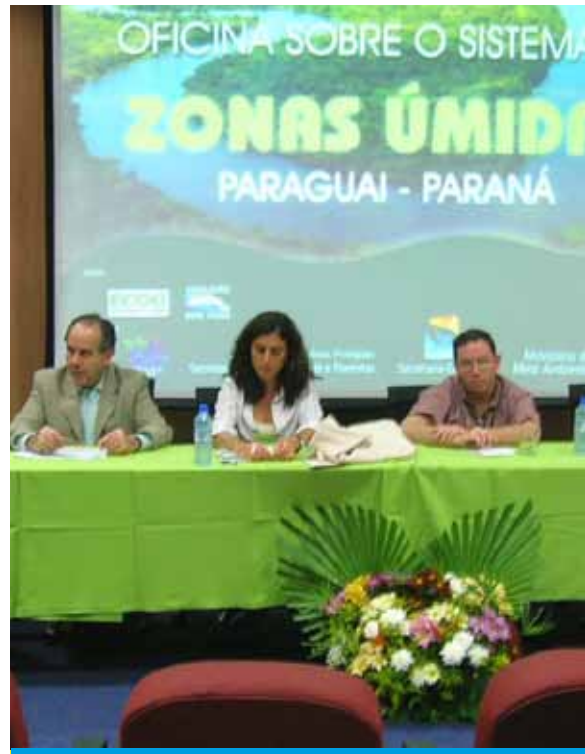
Reunión Poconé (agosto de 2005).

El SPP presenta un desafío innovador para conformar un sistema de gestión integrada respecto de áreas naturales locales y provinciales, reservas de biosfera, sitios Ramsar, Parques Nacionales y reservas privadas.