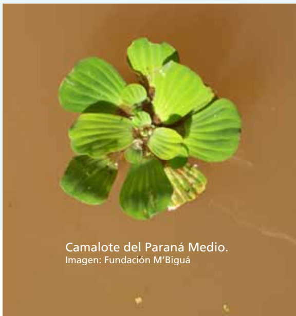
Camalote del Paraná Medio.

Meta 6.1: Implementar mecanismos regulatorios e instrumentos económicos que incentiven las prácticas sustentables y desfavorezcan aquellas que hacen un uso predatorio del ambiente, lo que supone programas y políticas diferenciadas y de "discriminación positiva". Estas medidas deben enfocarse en forma integral y su diseño e implementación debe contemplar el protago-