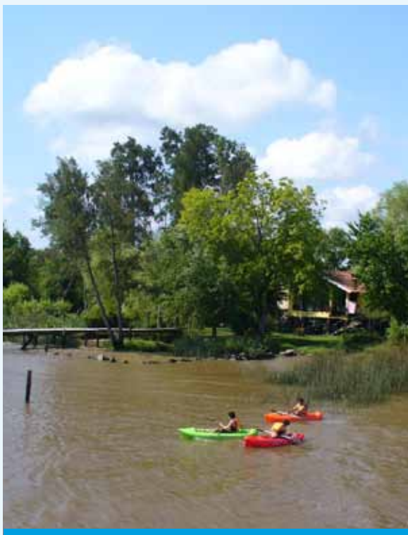
Recreo en el Tigre, Argentina.

otros) en el diseño e implementación de programas de salud para la población del SPP.