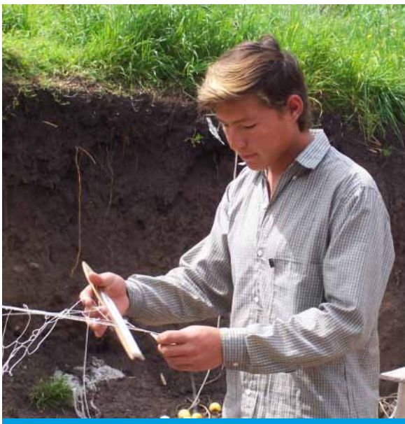
Isleño del Delta del Paraná, tejiendo red de pesca.